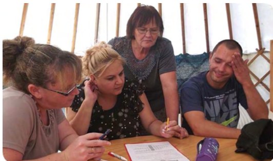
Fejtörő a jurtában

Augusztus 31-én , szerdán délelőtt került sor a Rozsnyai Gyűjtemény múzeumpedagógiai tanévnyitójára, ahol közel 30 pedagógus vett részt helyi és a környező települések iskoláiból. A résztvevők megismerhették a gyűjtemény új tanévre meghirdetett kibővült múzeumpedagógiai kínálatát, majd ezt követően részt vettek az „Egyedi Hétpróbán”, ahol a diákok vizsgáztatták a pedagógusokat, tanórákból ihletődve különböző játékos feladatokkal.